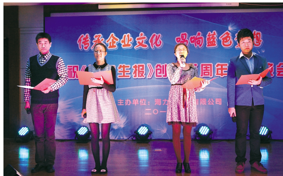
编辑部诗朗诵《海风》