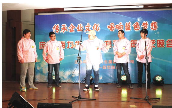
果品党支部小品《夸夸谁最棒》