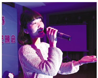
贸易支部女声独唱