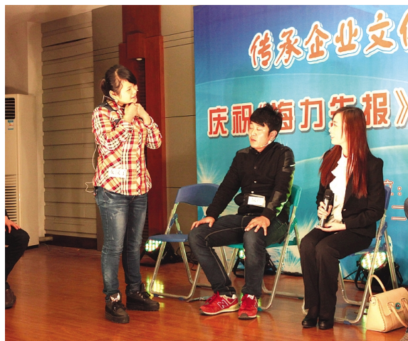
晶和党支部小品《说出你的梦想》