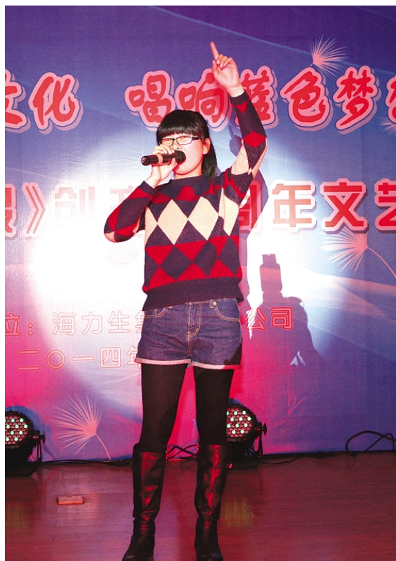
机关一支部女声独唱