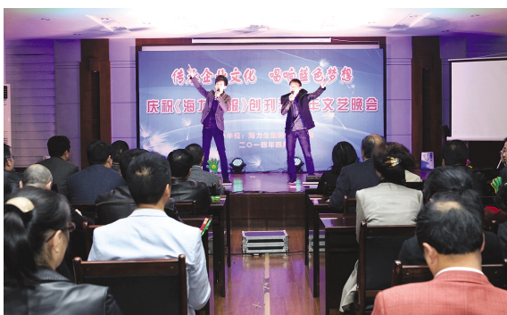
团委歌曲《海力生万万岁》