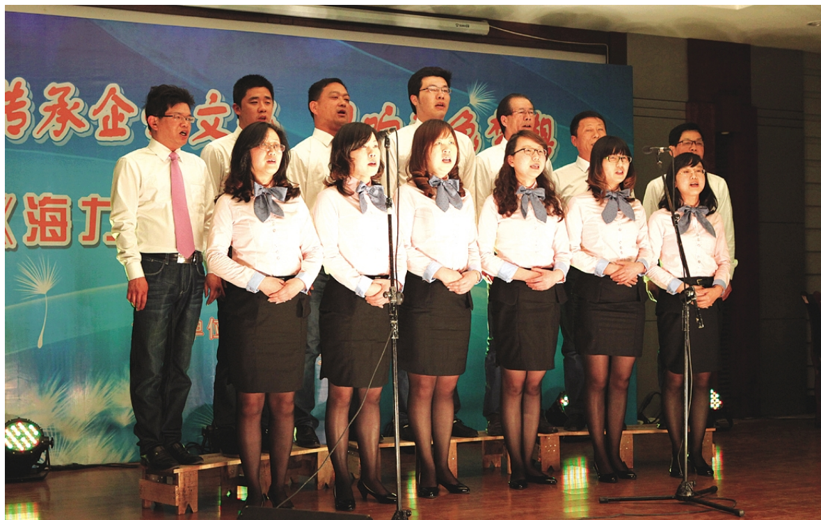
海博党支部合唱《鲜花献给海力生》