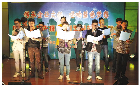
制药党总支诗朗诵《驰骋海洋》