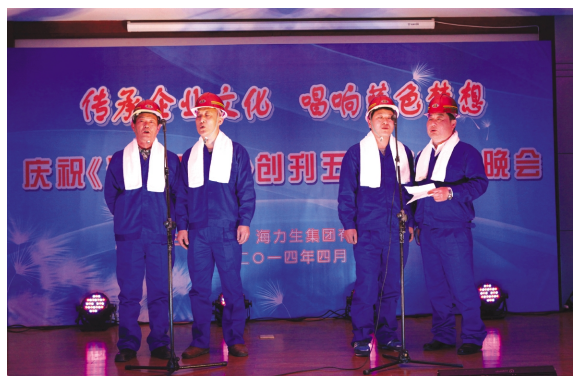
机关二支部小组唱《司炉员之歌》