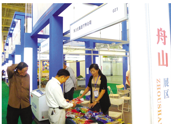
▲ 公司休闲食品和水产冻品展区