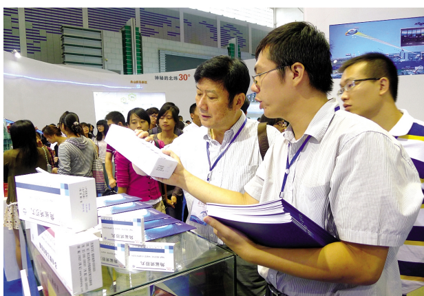
▲ 舟山展区生物医药展台

对离退休老同志提供照片等文献资料,公司将派员上门办理征集手续,扫描翻拍后及时送还。